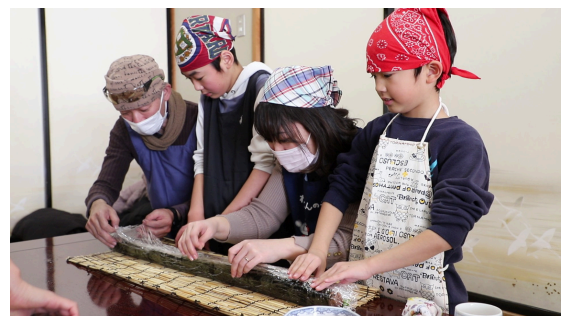
昨年の恵方巻づくりの様子です☆