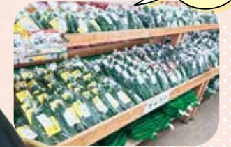
キュウリやトマト、ナスや オクラ、枝豆など抜群の 品揃えが自慢です