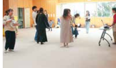
音楽に合わせたリズム遊びで交流する参加者