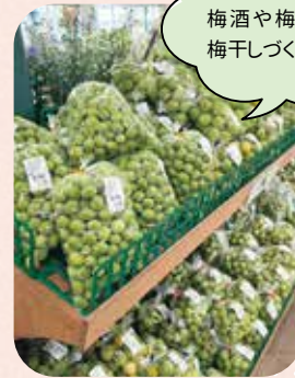
旬の梅、入荷中！ 梅酒や梅シロップ、 梅干しづくりに。

果物 続々入荷中！ ブルーベリーやラズベリー、 桃やプラムなど、旬の果物が 続々入荷します。