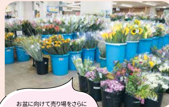
お盆に向けて売り場をさらに 充実！鮮度抜群の切り花は 花もちが良く好評です