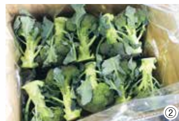
①畑をまわりながら、花蕾が直径15cmほどに育ったブロッコリーから順次収穫します ②収穫後は、鮮度保持シートで包装し、箱詰めします ③JAに出荷されたブロッコリーは専用の機械で真空予冷処理を行います。急速冷却することで品質を保ち、岩手県内を中心に出荷しています