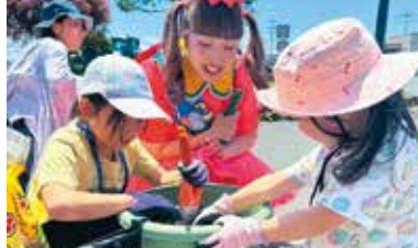
プランターにミニトマトの苗を植えました