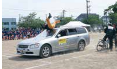
スタントマンによる自転車事故の再現